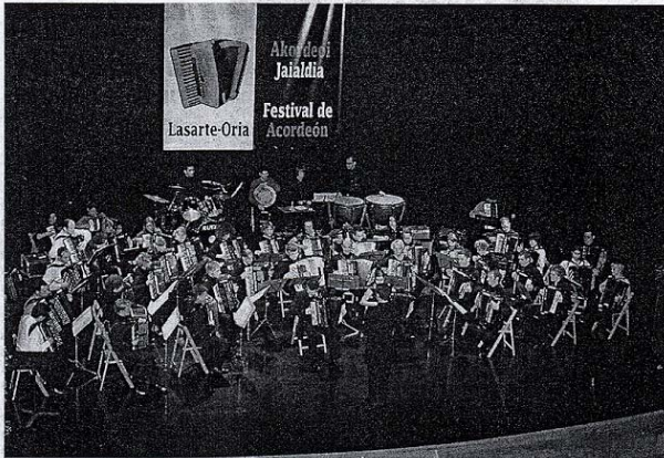
Akordeoi Jaialdia Festival de Acordeón Lasarte-Oria