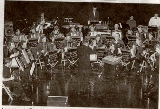
La orquesta Zero Sette actuará hoy en la Casa de Cultura. [TXEMA]

Ambos aunarán su experiencia musical en piezas como Amazone (M. Berthomieux); Basso ostinato (V. Vlasov); Grain de fantasie (J. Richard) o Iragana, con la firma