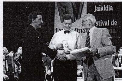
El director alemán entrega un recuerdo a los de Lasarte. [TXEMA]