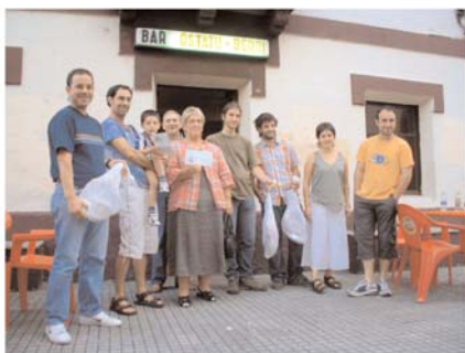
Los ganadores y premiados de la porra posan en el Ostatu. [TXEMA]