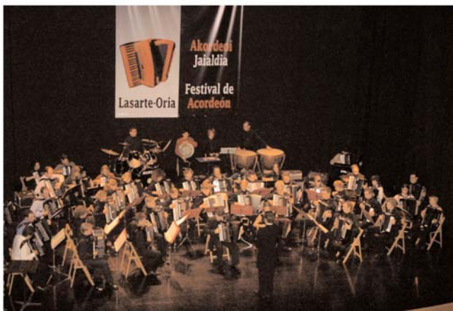
Para poner el broche de oro, la orquesta alemana, Zero Sette y el tándem Goikoetxea y Laburu interpretaron Giga. La pareja de acordeonistas dejó muy alto el listón musical. [TXEMA]