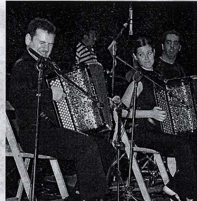
Para poner el broche de oro, la orquesta alemana Zero Sette y el tándem Goikoetxea y Laburu interpretaron 'Giga'. La pareja de acordeonistas dejó muy alto el listón musical. [TXEMA]