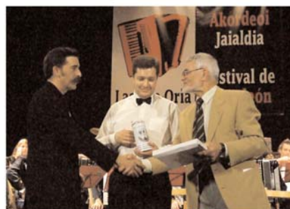
La orquesta alemana arrancó los aplausos de los presentes. [TXEMA]